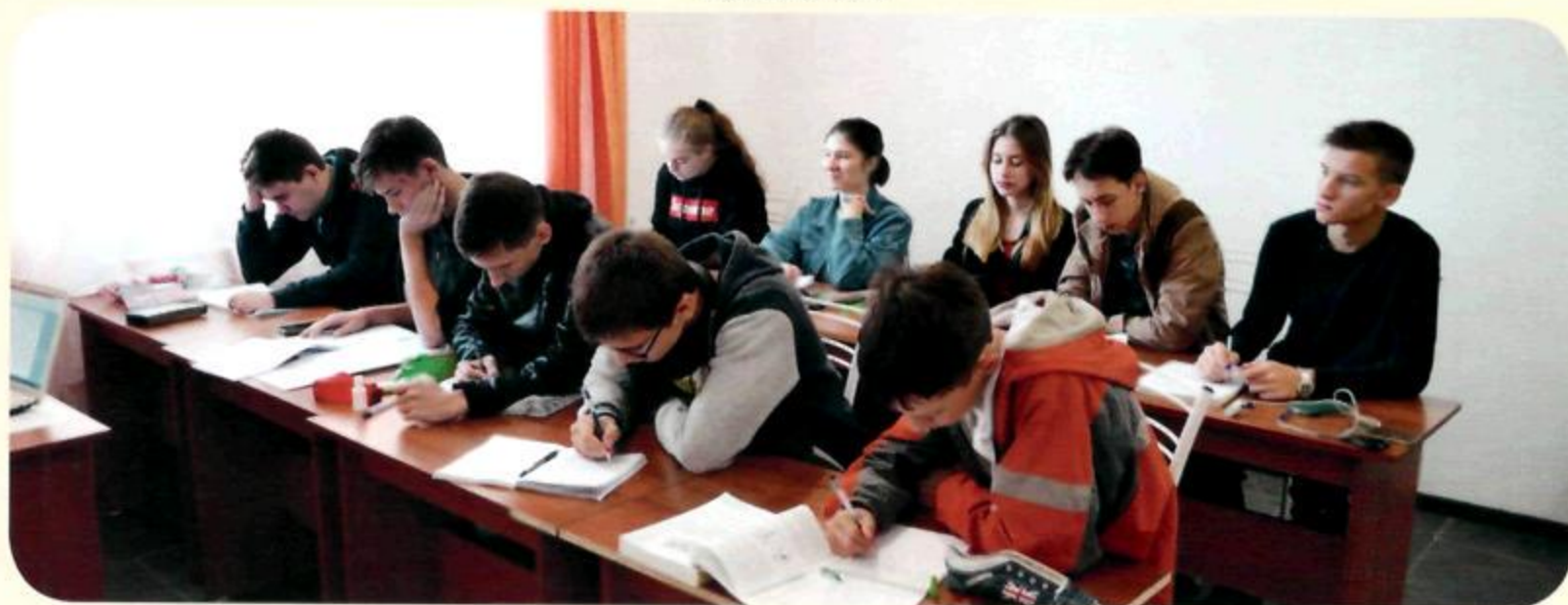
Кабинеты дополнительного образования