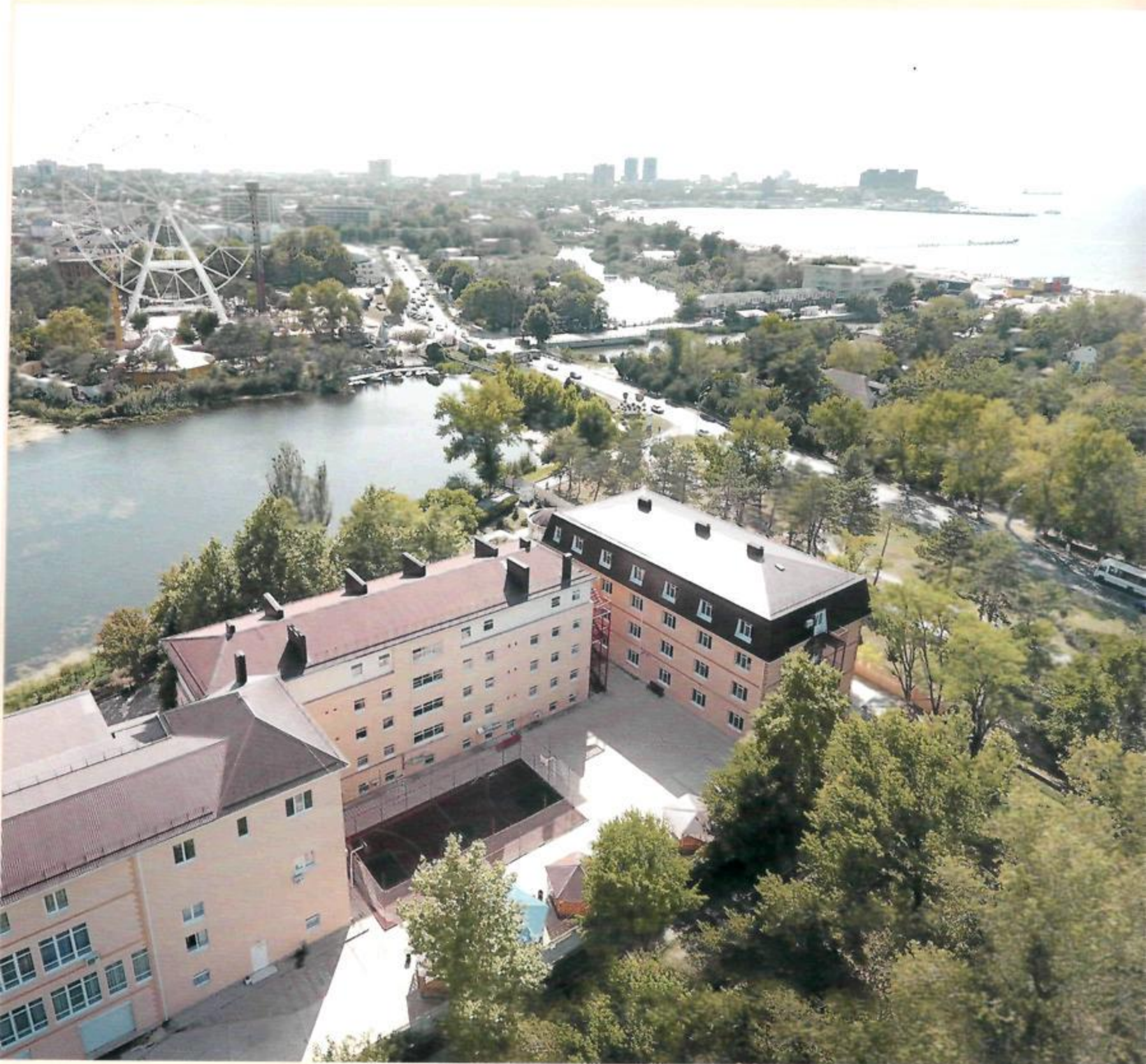
“Санаторий Янтарь” вид сверху