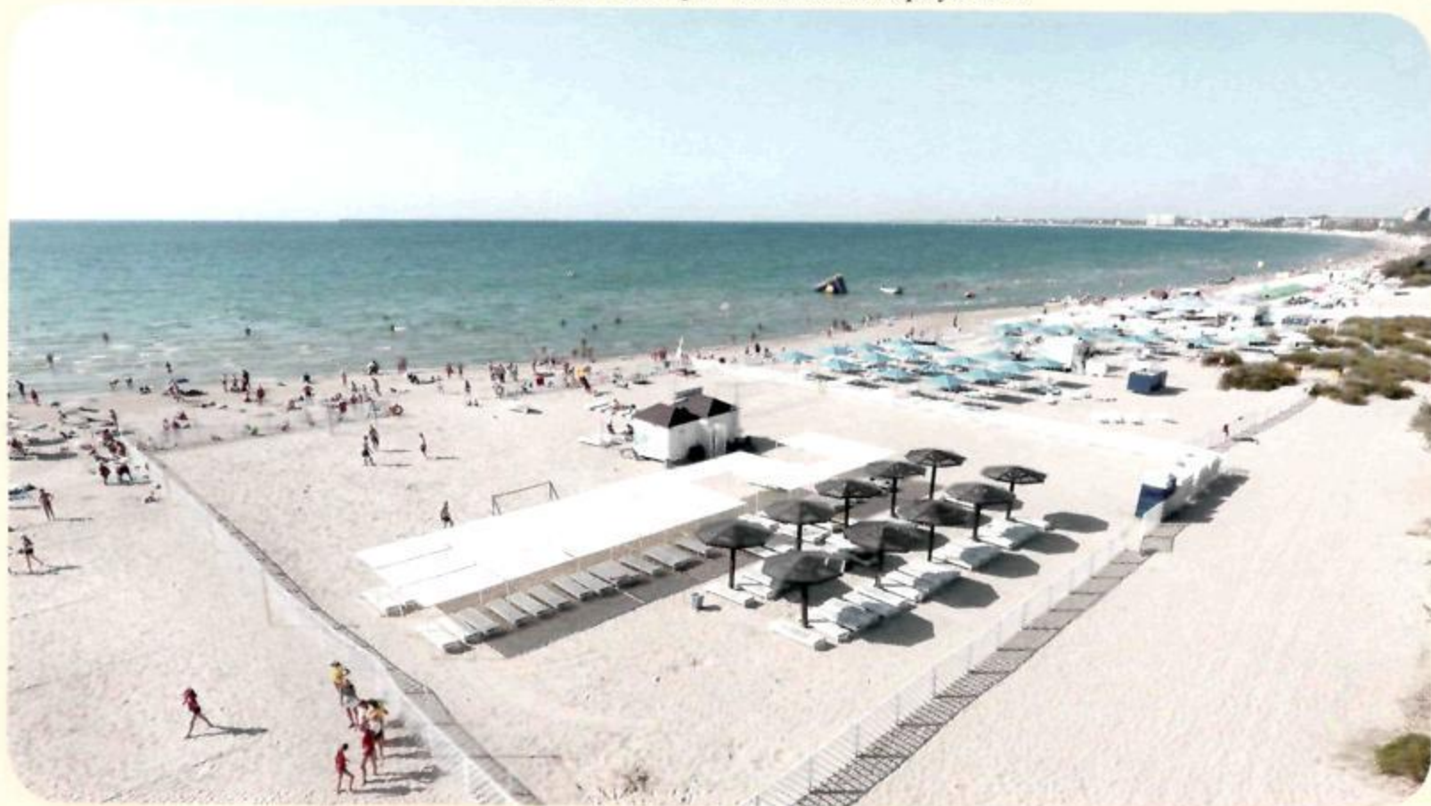
Пляж “Санаторий Янтарь”