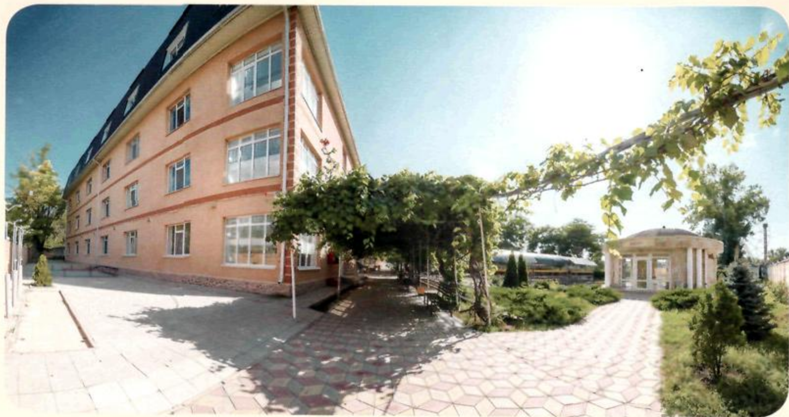
“Санаторий Янтарь” спальный корпус №2