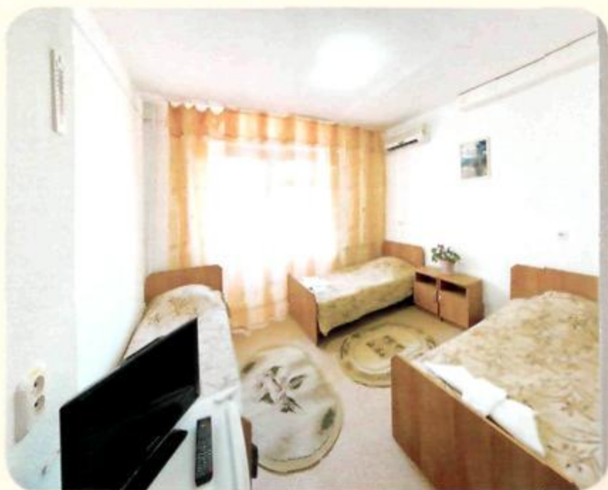
3-х местный номер