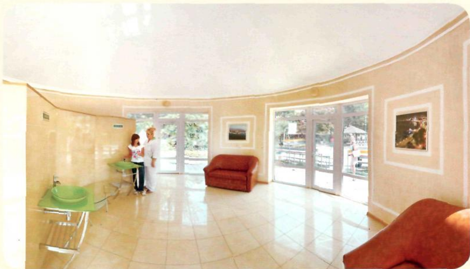
Питьевой бювет "Янтарный"