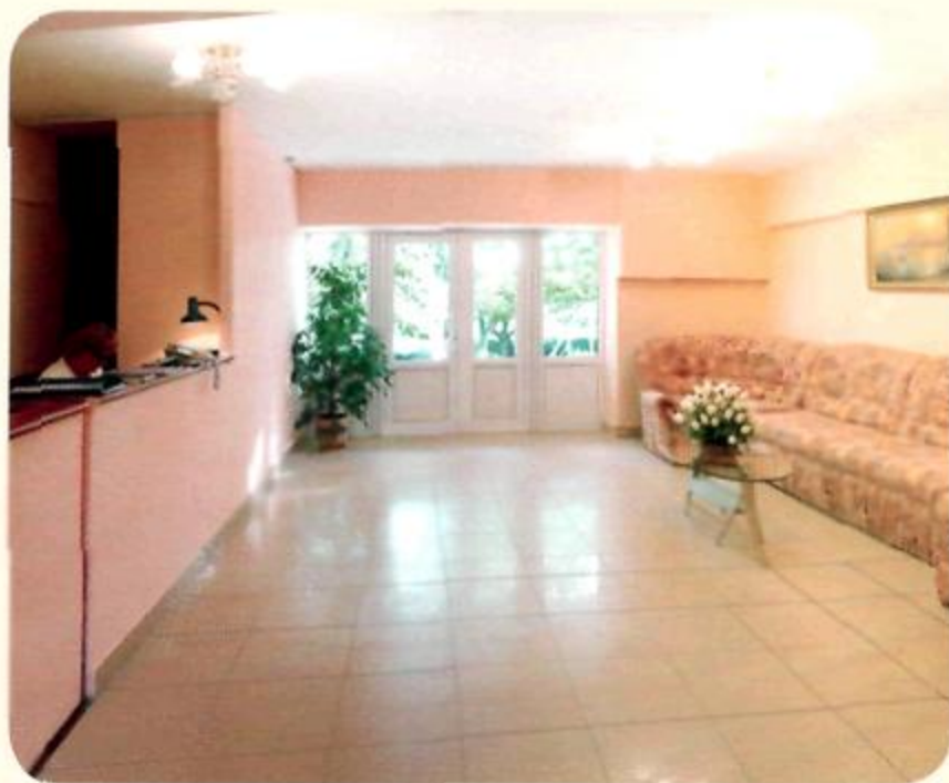
Спальный корпус №1 (ресепшен)

«Санаторий Янтарь» расположен в уникальном живописном уголке курортной зоны города-курорта Анапа на берегу реки Анапка, впадающей в Черное море. Это перспективная и динамично развивающаяся круглогодичная здравница, которая предлагает прекрасные возможности для совмещения оздоровления и отдыха детей со всех уголков России. На территории санатория находится детская площадка с уличными тренажерами, столы для настольного тенниса, спортивные площадки (волейбольная, баскетбольная, для большого тенниса) и футбольное поле. Также имеется детское кафе. Разнообразные тематические мероприятия ребята могут посетить в клубе детского творчества, там же с огромным удовольствием отдыхающие демонстрируют свои вокальные данные с помощью «Караоке». Придают красоту и уют ухоженные цветущие клумбы роз, которые расположены вдоль прогулочных дорожек. Вся территория санатория огорожена по всему периметру, круглосуточно охраняется и оснащена камерами видеонаблюдения. Ежегодно с детьми работает педагогический отряд, аниматоры, квалифицированные педагоги, психологи, воспитатели. Интересно и содержательно организован досуг: проводятся веселые конкурсы, концерты, культурно-развлекательные мероприятия, квесты, дискотеки, шоу-программы, соревнования. Ежедневно на «Янтарь-арене» ребята раскрывают и совершенствуют свои таланты, за что получают поощрительные призы.